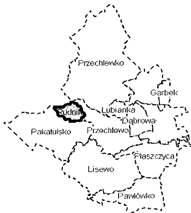
Rys. 1. Położenie Sołectwa Rudniki na tle Gminy Przechlewo.

Sołectwo Rudniki zajmuje powierzchnię 374,4687 ha (3,74 km 2 ) co stanowi 1,53 % powierzchni całej gminy. W jego skład wchodzi 4 miejscowości: Rudniki, Suszka, Trzęsacz, Wiśnica.