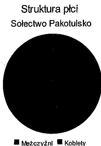
Wyk. 2. Struktura płci ludności w Sołectwie Pakotulsko.

W strukturze płci nieznacznie dominują mężczyźni – 99 osób (co stanowi 52,3% ogółu ludności sołectwa), kobiety – 89 osób (co stanowi 47,7% ogółu ludności sołectwa). Strukturę płci w sołectwie Pakotulsko przedstawia wykres poniżej.