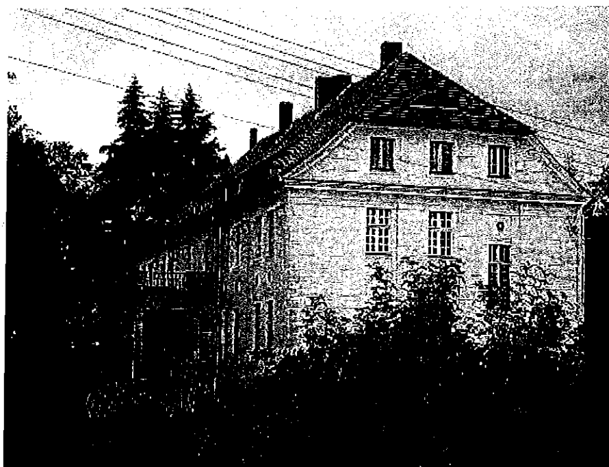
Fotografia 1. Zespół dworsko-pałacowy w Dąbrowie Człuchowskiej