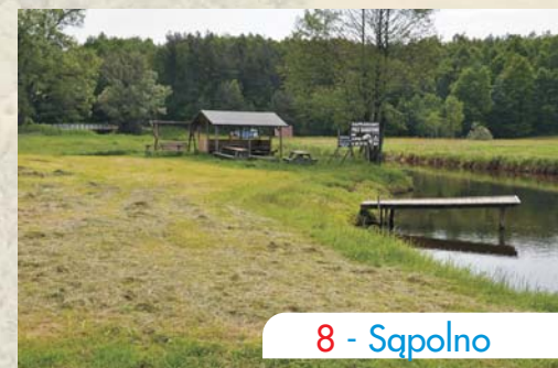
8 - Sapolno