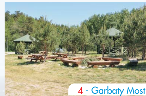
4 - Garbaty Most