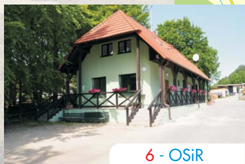
6 - OSiR