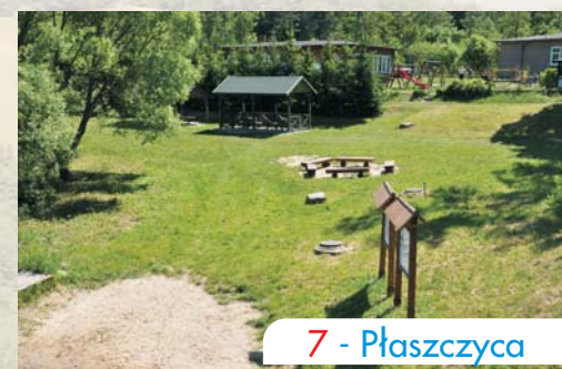
7 - Płaszczycza