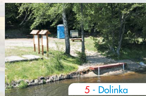
5 - Dolinka