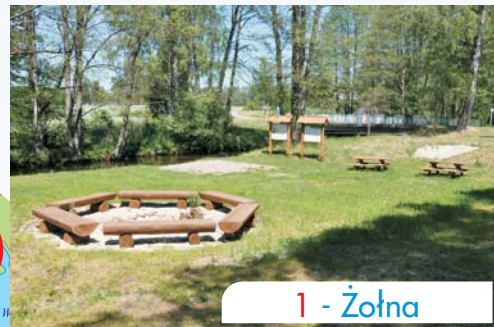
1 - Żoła