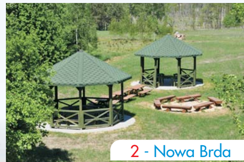
2 - Nowa Brda